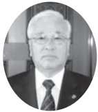
志摩市商工会 顧問