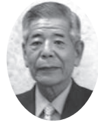
志摩市商工会会長