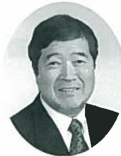
志摩市商工会会長