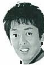
講師に落語家の桂三若氏をお迎えして「笑