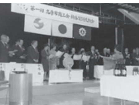
第1回新春賀詞交歓会のようす(志摩市商工会)

地域の様々な職業の皆様と趣味を通じて交流することにより、地域を活性化するアイデアを生み出すチャンスの場、また、同じ趣味を持つ者同士腕を磨き合う機会になればと左記の要領で開催します。